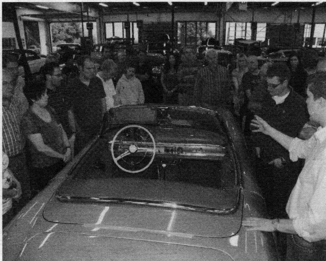
Die interessierten Oldtimer-Freunde an einem 300SL-Roadster.

KIENLE hat sich auf drei Mercedes-Typen spezialisiert: 300SL, 600er und 300S, restauriert auf Anfrage aber auch alle anderen Typen. Im Werkstattbereich stand der Gitter-Rahmen von Jean Todts 300SL-Flügelträger. Das Fahrzeug des ehemaligen Formel1-Teamchef in der Ferrari-Ära Michael Schumacher ist derzeit komplett zerlegt. Peinlichst genau sortiert und beschriftet liegen die Einzelteile auf Wagen gestapelt und warten auf den Zusammenbau. Die Karosserie des Flügelträgers ist bereits fertig. Für die Restaurierung eines derartigen Fahrzeugs muss der Eigner ca. 3-5 Jahre einplanen, bis er dann mit seinem Schmuckstück vom Hof fahren darf.